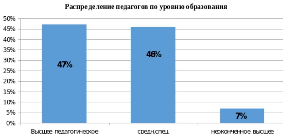
Диаграмма с характеристиками кадрового состава детского сада.

Курсы повышения квалификации в 2022 году прошли 17 педагогов. На 30.12.2022 1 педагог проходит обучение в ВУЗе по педагогической специальности, 1 педагог проходит обучение в колледже по педагогической специальности.